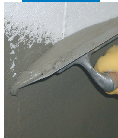
Εξομάλυνση θερμομονωτικών πλακών: Άπλωμα του Mapetherm AR1

Παρότι τα τεχνικά στοιχεία και οι συστάσεις βασίζονται στις εκτενείς γνώσεις και την εμπειρία μας, οι ως άνω πληροφορίες στο σύνολο τους πρέπει να θεωρούνται απλά ως ενδεικτικές και να υπόκεινται σε επανεξέταση βάσει της μακροχρόνιας πρακτικής εφαρμογής. Για το λόγο αυτό πρέπει να εξετάζεται η καταλληλότητα του προϊόντος για την συγκεκριμένη χρήση. Σε κάθε περίπτωση, ο χρήστης φέρει την αποκλειστική και πλήρη ευθύνη για τυχόν επιπτώσεις από την χρήση του προϊόντος.