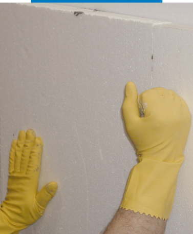
Εφαρμόστε πίεση στις μονωτικές πλάκες μόλις τοποθετηθούν. Έτσι εξασφαλίζεται η καλύτερη συγκόλληση στο υπόστρωμα