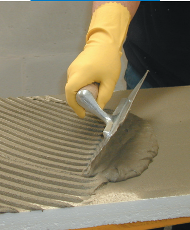
Εφαρμογή του Mapetherm AR1 στην πλάτη της μονωτικής πλάκας με οδοντωτή σπάτουλα