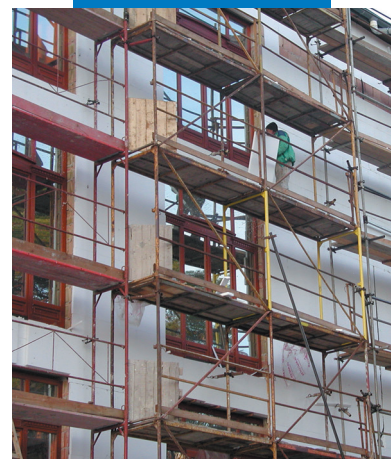
Συγκόλληση των μονωτικών πλακών στην εξωτερική όψη με Mapetherm AR1