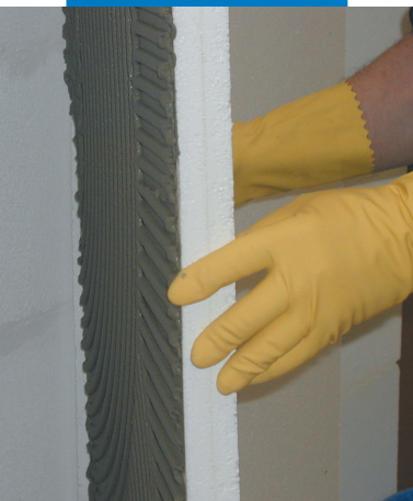
Τοποθέτηση της θερμομονωτικής πλάκας